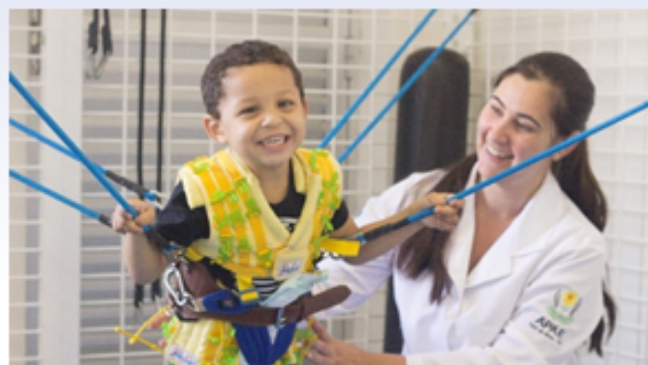
Usuário do CER de Pará de Minas.