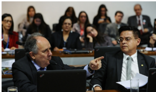
O Senador Cristovam Buarque e o deputado Eduardo Barbosa.

06 de outubro de 2017 Informativo nº 268